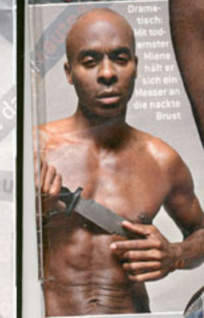
Drama- tisch: Mit tod- ernster Miene hält er sich ein Messer an die nackte Brust