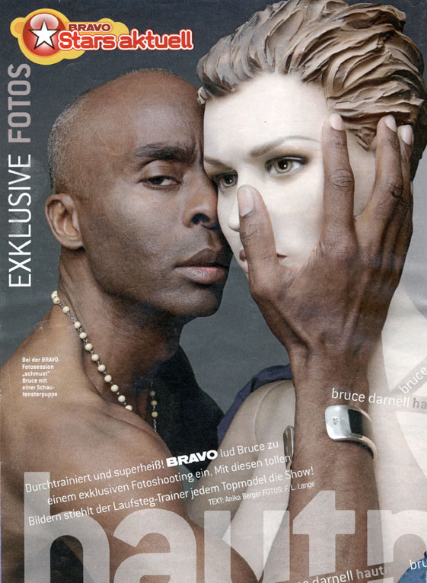
Bei der BRAVO-Fotosession „schmüst“ Bruce mit einer Schau- fensterpuppe

Durchtrainiert und superheiß! BRAVO lud Bruce zu einem exklusiven Fotoshooting ein. Mit diesen tollen Bildern stiehlt der Laufsteg-Trainer jedem Topmodel die Show! TEXT: Anika Berger